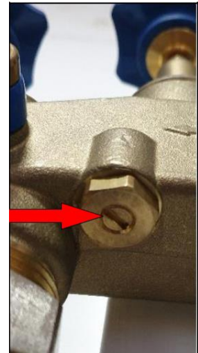
Stelschroef voor resthardheidinstelling

Door aan de stelschroef te draaien verandert u ook de menging met hard water.