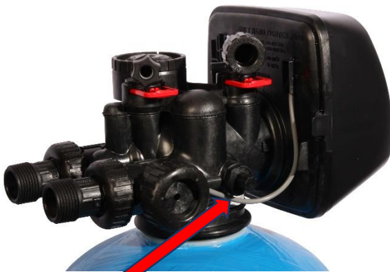
Stelschroef voor resthardheidinstelling

Door aan de stelschroef te draaien verandert u de menging met hard water.