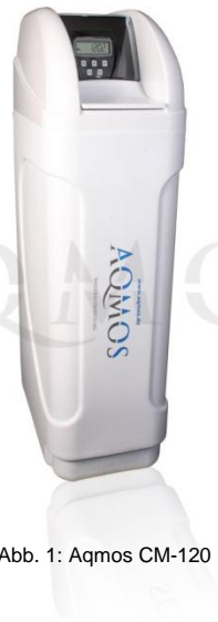
Abb. 1: Aqmos CM-120