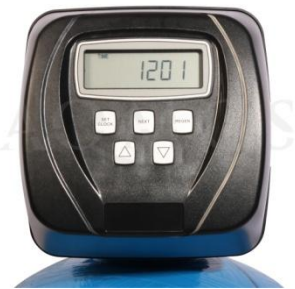
Abb. 2: Steuerventil Clack WS 1 CI

GFK- Druckflasche, gefüllt mit hochwertigem Ionenaustauscherharz, Kabinettgehäuse für einen Salzvorrat von max. 70kg, mengengesteuertes Zentralsteuerventil Typ Clack WS 1 CI, integriertes Feinverschneidungsventil, Absaugeinrichtung und Verbindungsleitung zum Zentralsteuerventil.